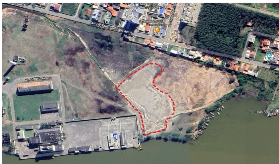
Figura 01 – Material Depositado